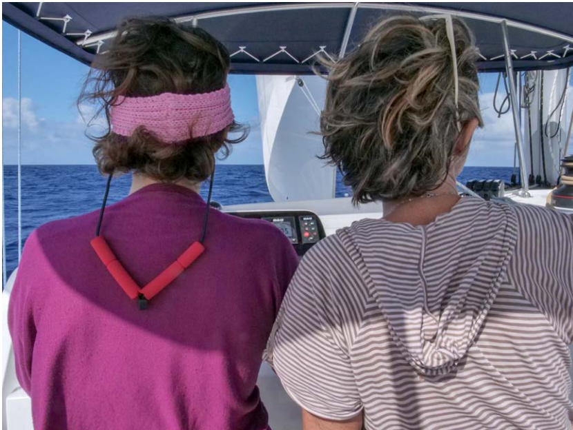
Traversée de l'Atlantique avec r'Ose Transat, novembre 2019

Stages d'une semaine en Bretagne et en Méditerranée Juin et septembre 2021