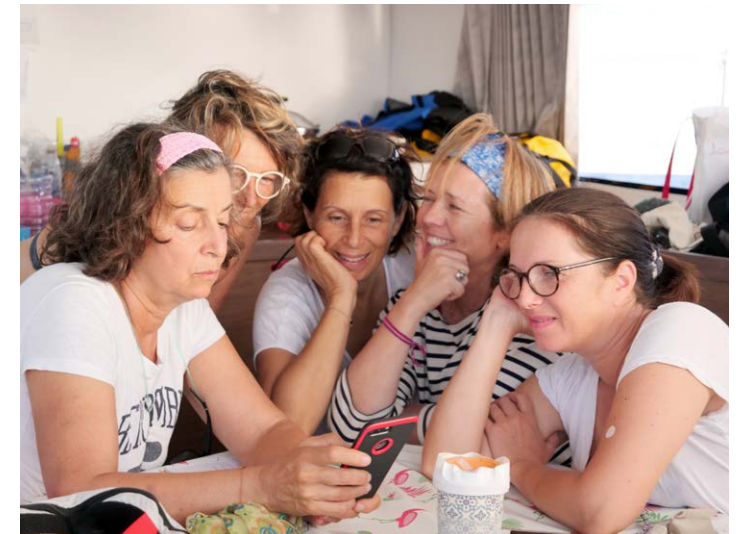
Le cœur des femmes, à bord de r'Ose Transat, novembre 2019